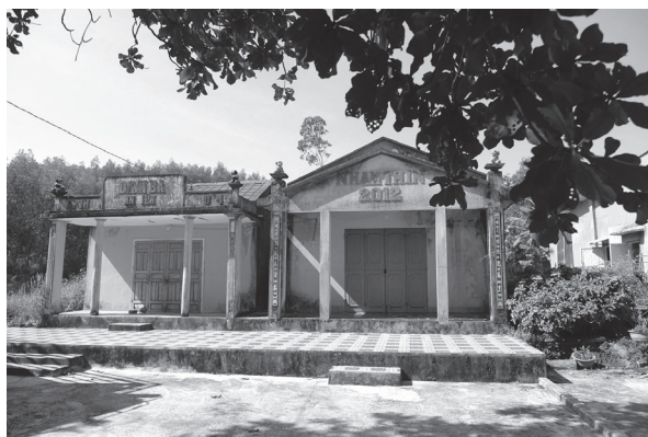
Dinh Bà Yã Đổ ở xã Cũ An.

Quan trọng hơn, hình tượng Dinh bà Yã Đổ mang giá trị liên văn hóa sâu sắc, thể hiện sự giao lưu, tiếp xúc và hòa hợp giữa người Kinh và các tộc người bản địa Tây Nguyên trong tiến trình lịch sử Tây Sơn. Không gian tín ngưỡng dinh Bà vì vậy không chỉ là nơi thực hành niềm tin dân gian, mà còn là “ký ức văn hóa” sống động về quan hệ Kinh - Thượng, góp phần lý giải tính đa dạng và linh hoạt của tín ngưỡng thờ Mẫu ở vùng Tây Sơn Thượng đạo.