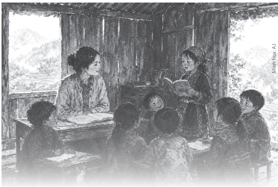
Minh họa: A.J

được chừng ba mươi phút, cả đám dừng lại trước một gốc cây cổ thụ da dẻ xù xì, râu bám xanh ngắt. Bên dưới đồng lá mục ẩm ướt, một khóm lan nở muôn đang vươn lên, cánh hoa vàng rực như vệt lửa sót lại giữa bóng tối của rừng già.