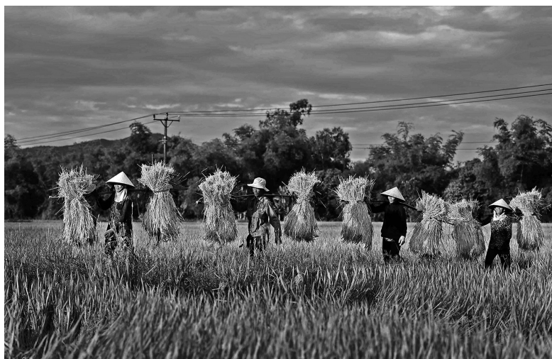
Gánh, gánh về.