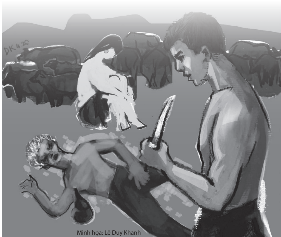
Minh họa: Lê Duy Khanh

đã ứa nước miếng. Nhưng mẹ, và cả rượu, không giữ được chân cha. Vì sao? H'Ril không biết. Có lẽ mẹ cũng không biết. Thế nên mẹ mới để nửa cuộc đời còn lại của mình chơi vơi đến thế. Như thể mẹ và cả H'Ril đã chết hẳn dưới dòng Ea Krăng năm đó. Mẹ lẳng câm, như cột gỗ giữa nhà. H'Ril cũng quen với ngôi nhà chẳng mấy khi có tiếng nói. Thứ lẳng câm như mối một âm thầm gặm nhấm, đục rỗng H'Ril từ bên trong. Lớn hơn chút, H'Ril lại thấy mẹ như thể cây hoa mọc giữa lưng chừng vực thẳm, không vươn nổi về phía mặt trời, nhưng cũng không thể rơi hẳn xuống đáy vực mà chết. Thế nên mẹ cứ ơ hồ sống. Như đơn giản không chết được thì sống, thế thôi.