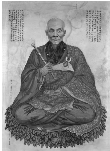
Tranh chân dung Thiền sư Nguyễn Thiệu