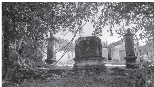
Bình phong, trụ biểu phía trước dinh Bà.