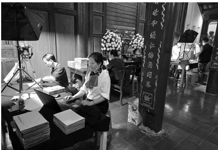
Nhóm nghiên cứu tiến hành số hóa bước đầu bộ Gia Hưng tạng tại chùa Thập Tháp.

Thứ nhất, xét về cấu trúc văn bản, Gia Hưng tạng bao gồm đầy đủ các thành phần như Kinh, Luật, Luận, Ngũ lục..., phản ánh một hệ thống tri thức Phật giáo hoàn chỉnh. Việc khảo sát thành phần kinh điển hiện còn tại Thập Tháp có thể giúp nhận diện các dòng tư tưởng được tiếp nhận, mức độ phổ biến của từng loại văn bản; sự ưu tiên của tầng đoàn đối với những hệ tư tưởng nhất định. Điều này cho thấy, việc phân tích thành phần Đại tạng kinh có thể cho thấy bản đồ tri thức của một cộng đồng Phật giáo cụ thể.