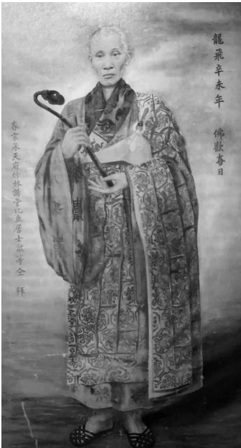
Tranh chân dung Quốc sư Phước Huệ